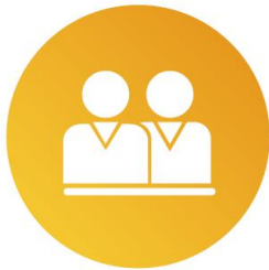
中国、俄罗斯、白俄罗斯本土化 多语言专业运营团队