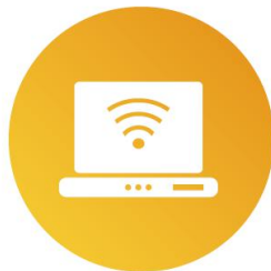
自主研发“数字化营销交易平台”