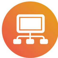
覆盖俄罗斯全境的仓储 分拨管理系统